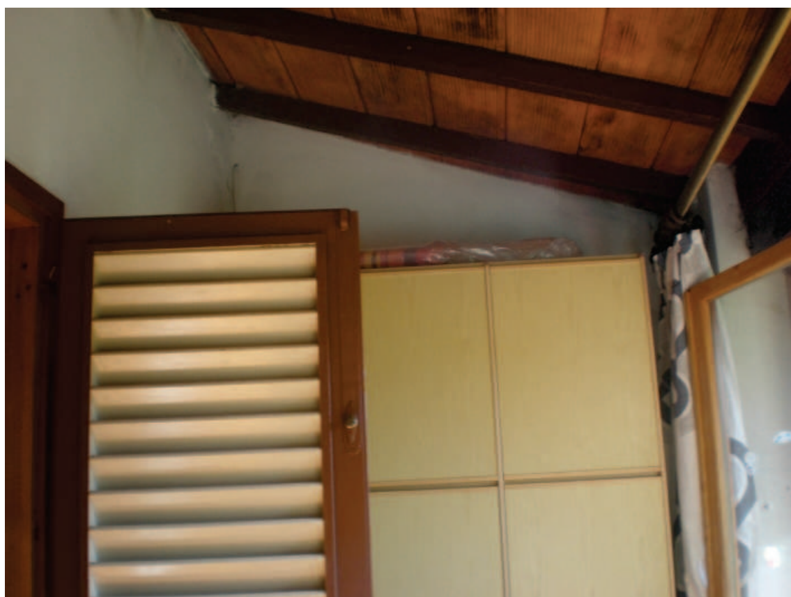
Foto 22. Particolare della Veranda.