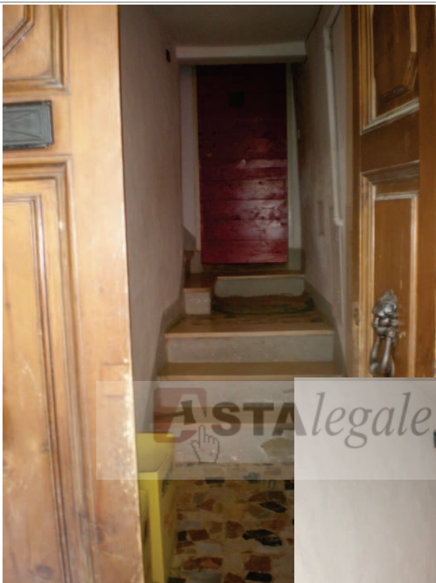
Foto 9. Le scale condominiale, P.T.