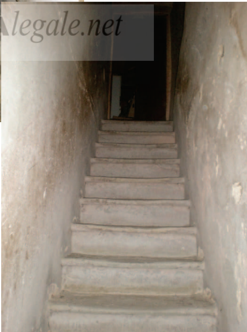
Foto 32. Le Scale del 2° accesso all'abitazione, da via Garibaldi.