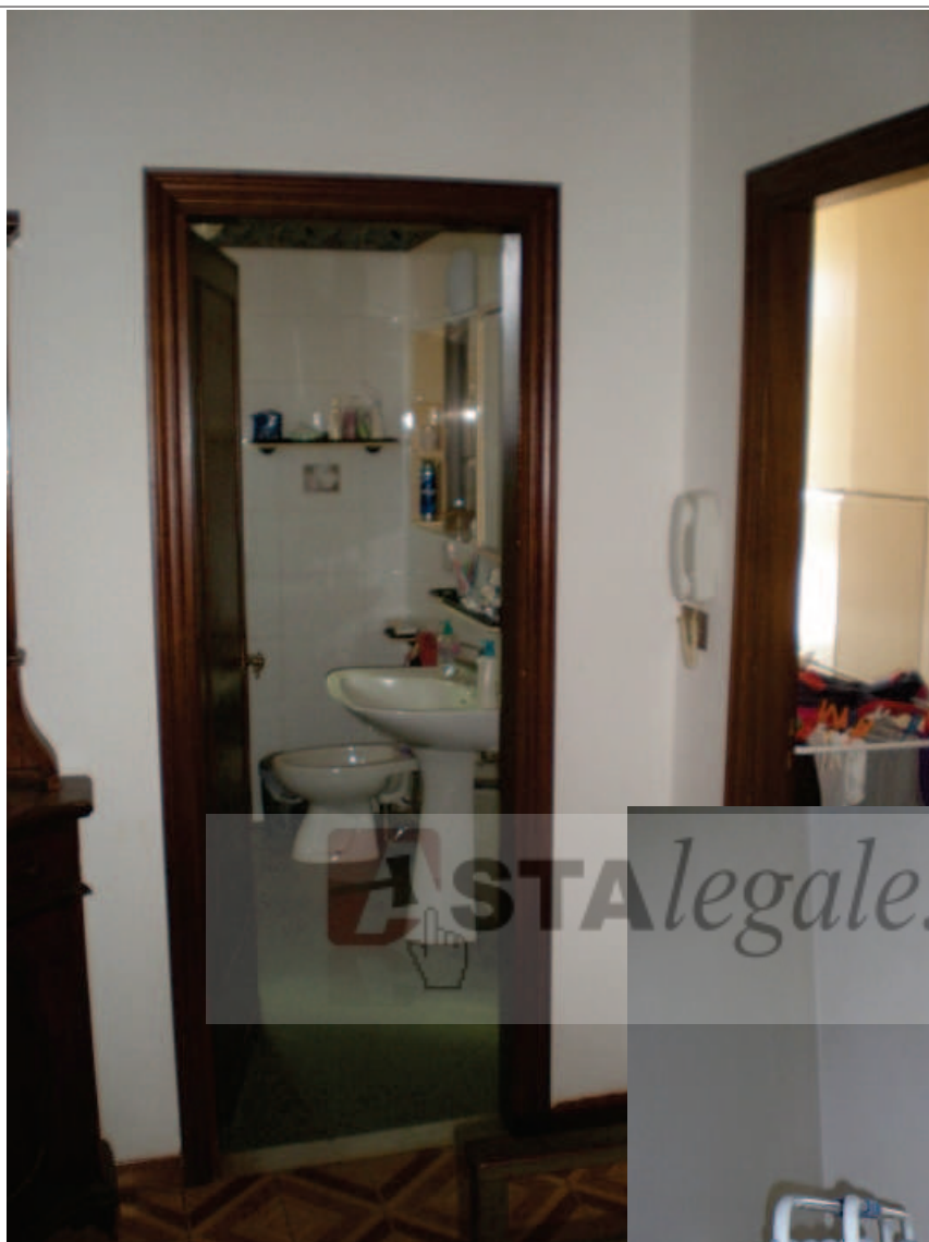
Foto 39. Il Disimpegno 2, di fronte il Bagno, a destra il locale Lavanderia.