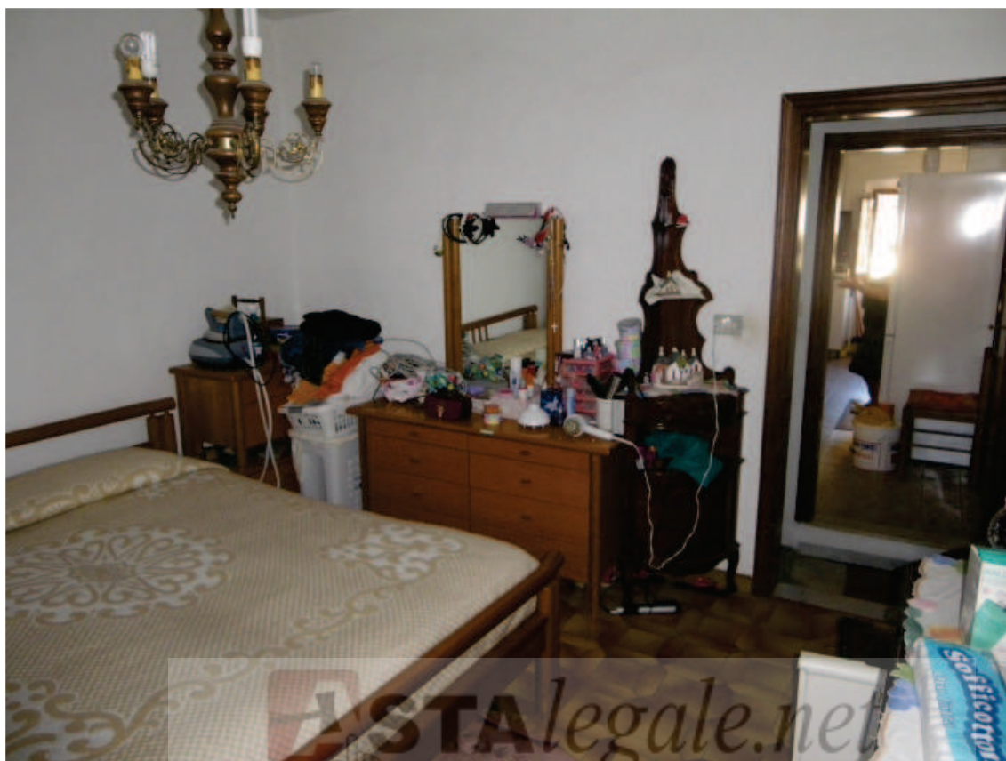
Foto 17. La Camera 3, in fondo la Cucina.