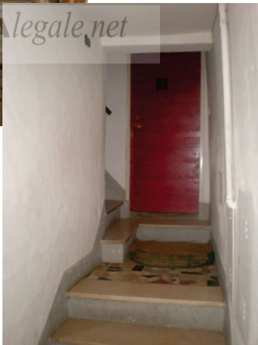
Foto 10. Le scale condominiale, P.T.