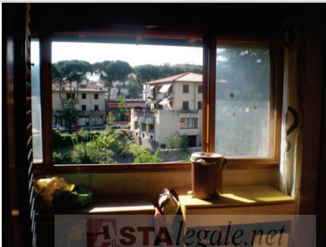
Foto 21. La Veranda con vista sul retro dell'abitazione