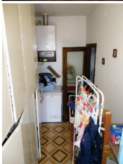
Foto 41. Il locale Lavanderia, a destra il Disimpegno 2.