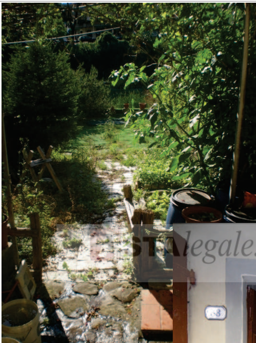
Foto 7. Le Fosse Biologiche, sul retro dell'abitazione.