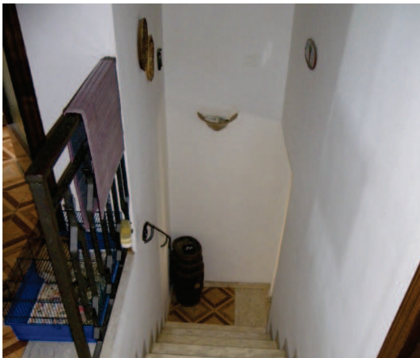
Foto 33. Le scale interne, in fondo a destra la Cucina.