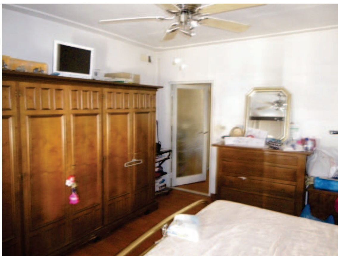
Foto 24. La Camera 1, in fondo la porta dal Disimpegno.