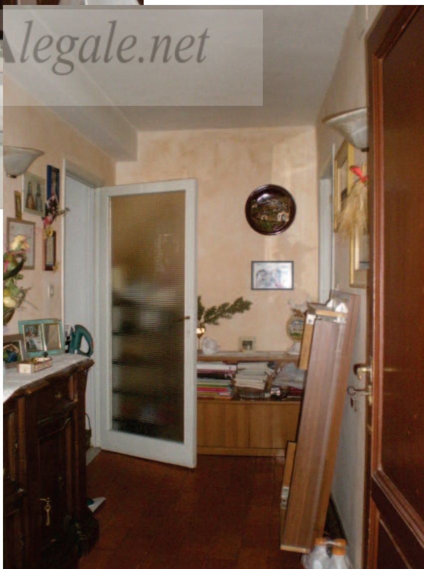
Foto 14. Il Disimpegno al Piano Secondo.