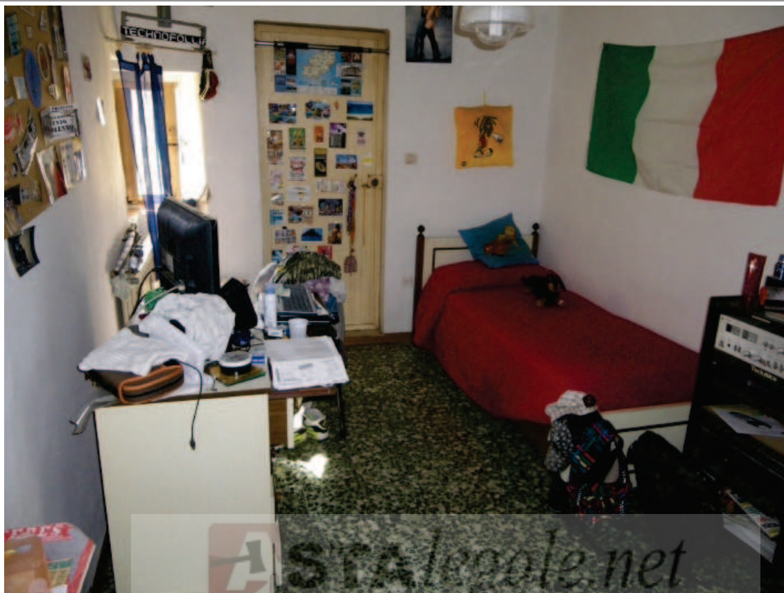
Foto 25. La Camera 2, in fondo la porta di accesso al locale di Sbratto.