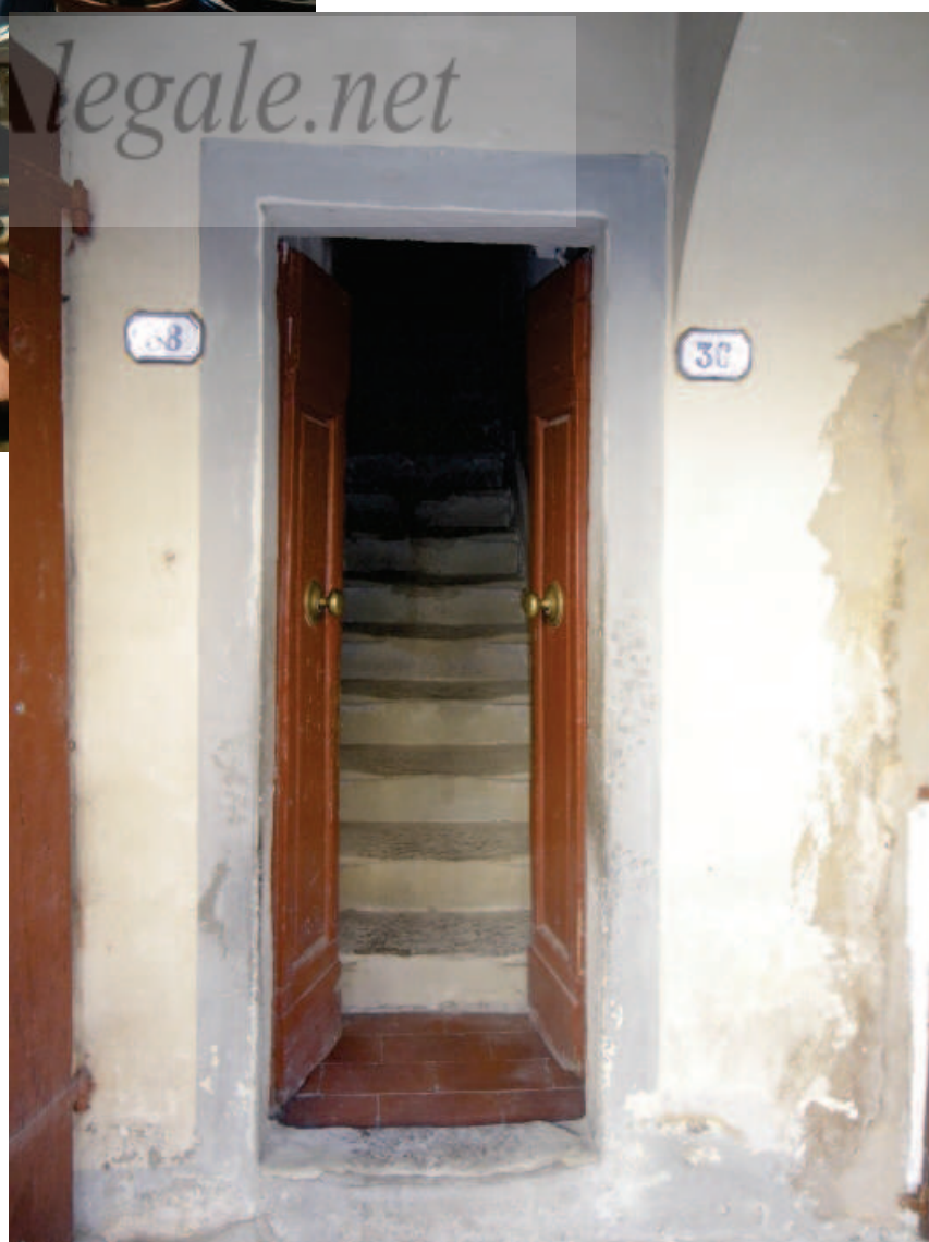
Foto 8. Via Garibaldi, il portone d'ingresso, con le scale che conducono al 1° e 2° P.