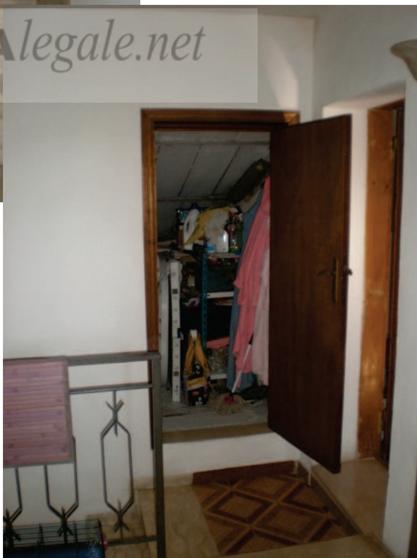
Foto 36. Il Pianerottolo, in fondo la Soffitta 1, a destra la Soffitta 2.