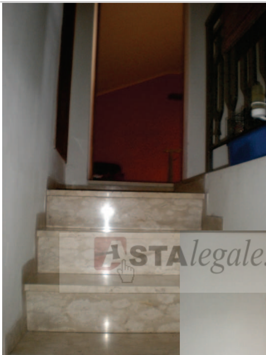
Foto 35. Le scale interne, in fondo la Soffitta, a destra il Bagno.