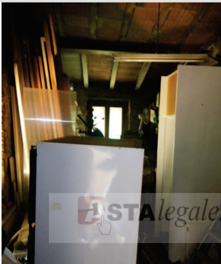
Foto 27. Il locale di Sbratto, la finestra da sul retro dell'abitazione.