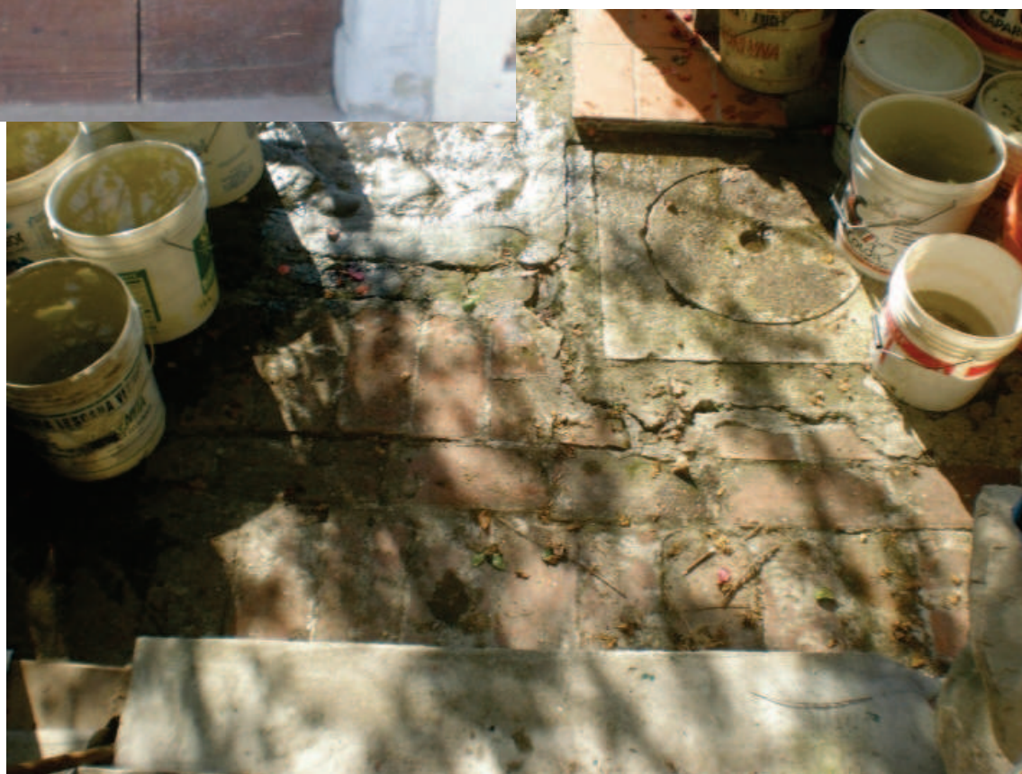
Foto 6. Le Fosse Biologiche, sul retro dell'abitazione.