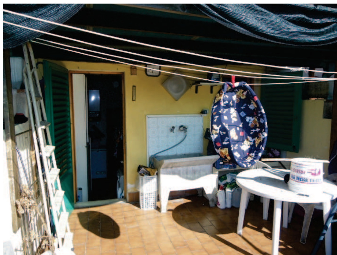
Foto 43. La Terrazza, di fronte il locale Lavanderia.