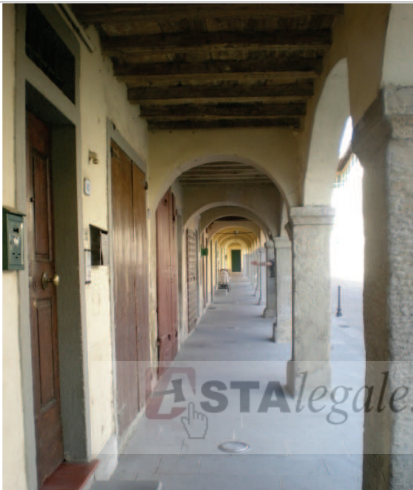
Foto 3. Via Garibaldi, a sinistra l'ingresso a P.T.