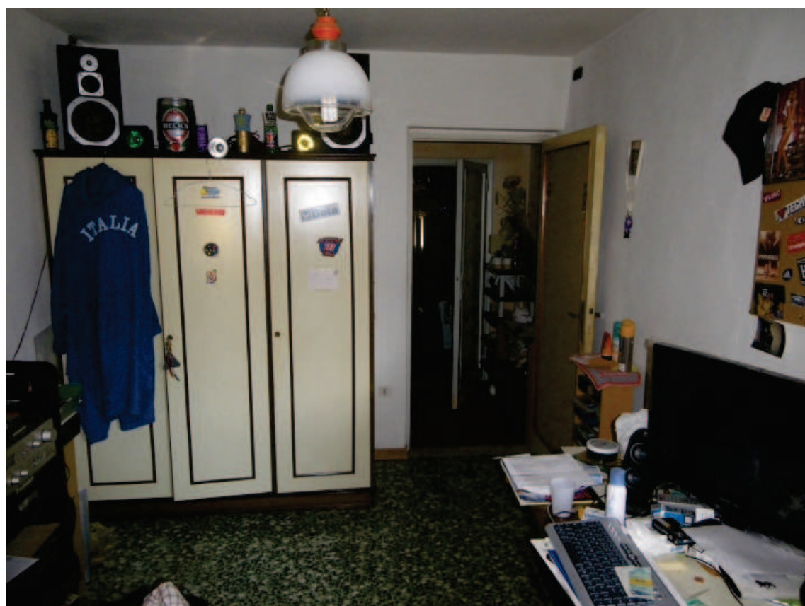
Foto 26. La Camera 2, in fondo il Disimpegno e la Camera 1.