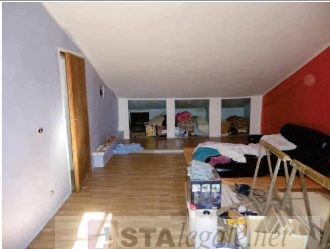
Foto 46. La Soffitta 2.