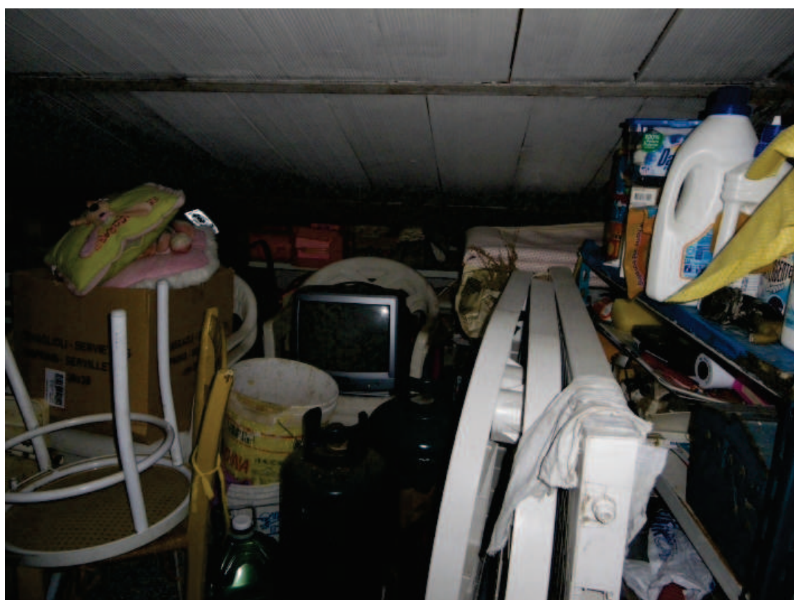
Foto 47. La Soffitta 1, utilizzata come Ripostiglio.