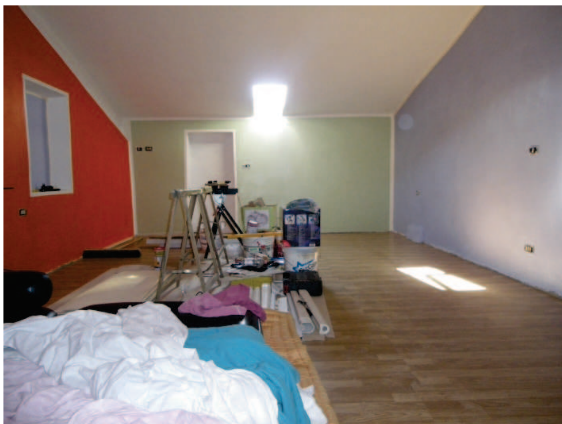
Foto 45. La Soffitta 2, in fondo la parete divisoria del locale di Sbratto.