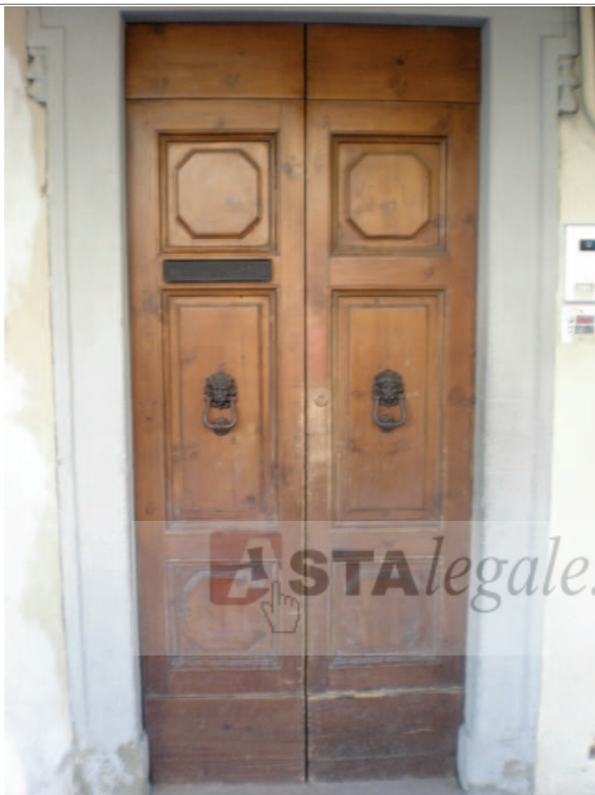
Foto 5. Via Garibaldi, il portone d'ingresso a P.T.