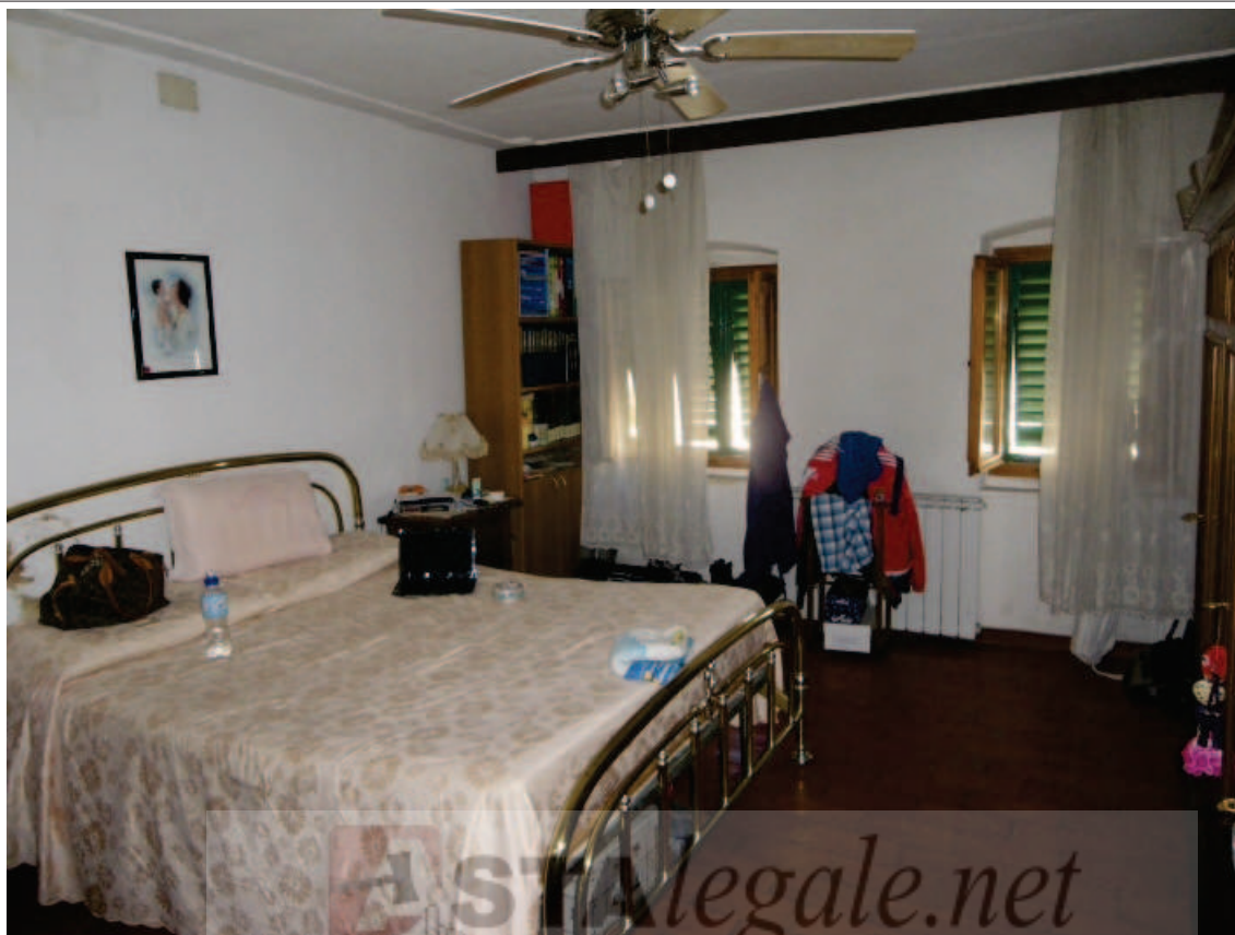
Foto 23. La Camera 1, le finestre si affacciano su via Garibaldi.