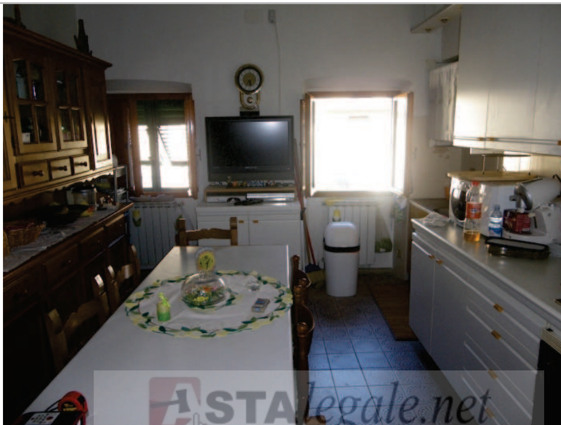
Foto 15. La Cucina, in fondo le finestre su via Garibaldi.