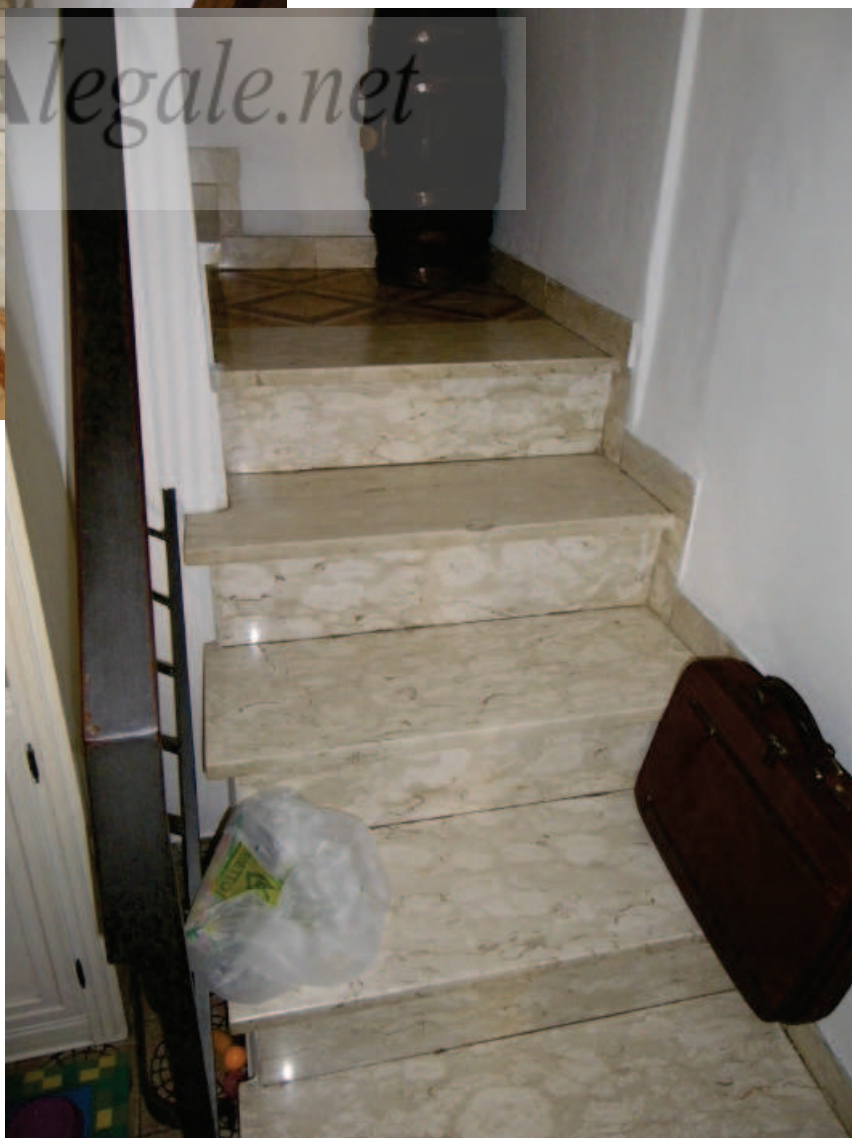
Foto 34. Le scale interne viste dalla Cucina.