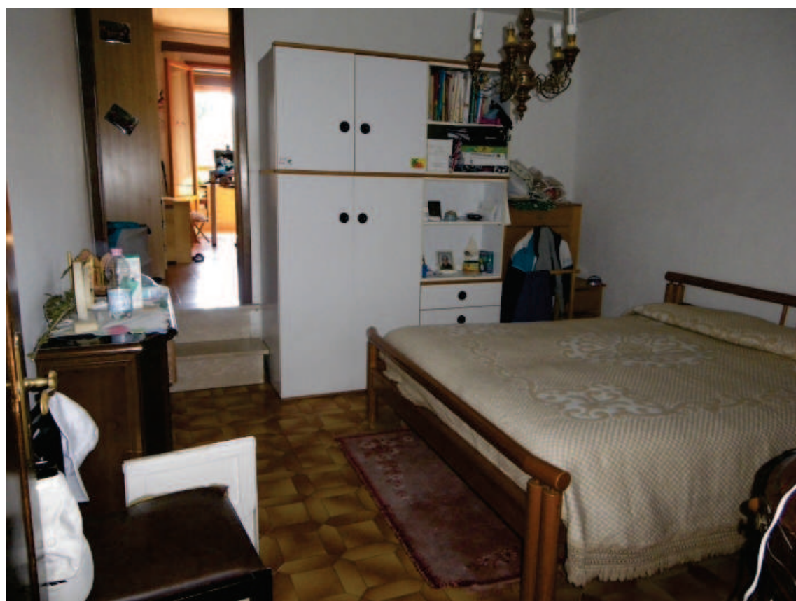
Foto 18. La Camera 3, in fondo la Cucina.