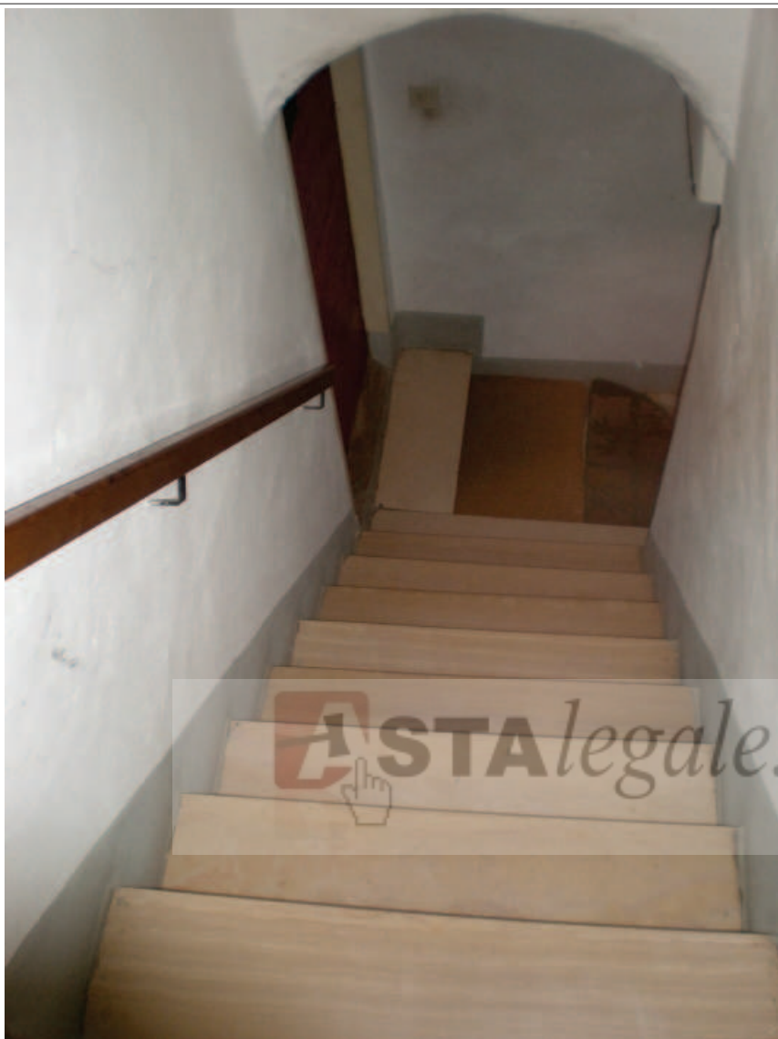
Foto 11. Le scale condominiale.