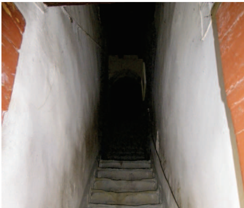
Foto 31. Le Scale del 2° accesso all'abitazione, da via Garibaldi.